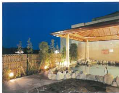
前の晩からゆっくりと温泉で おくつろぎください