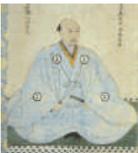
因島村上水軍6代当主 村上新蔵人吉充