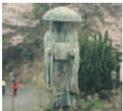
高さ5mの弘法大師像